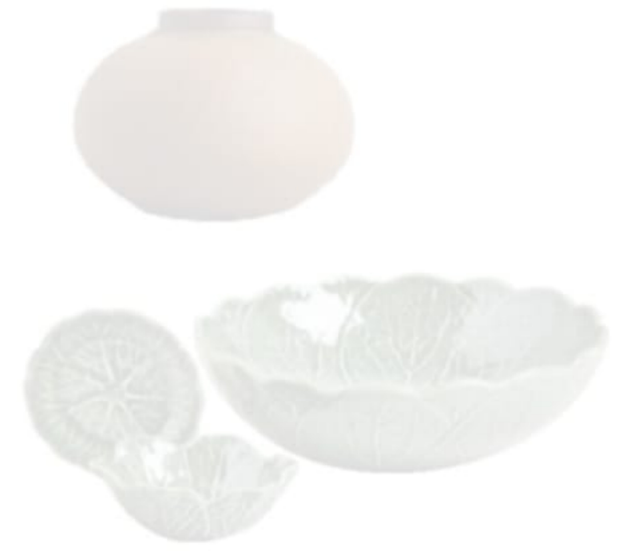
Vazo: 390 TL., kase seti: 270-1.190 TL., Zara Home.