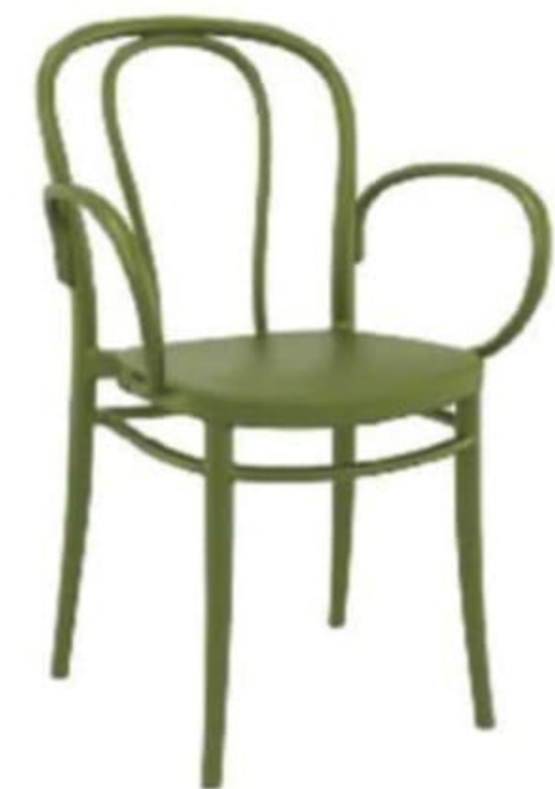
Victor sandalye: 2.585 TL., Siesta.