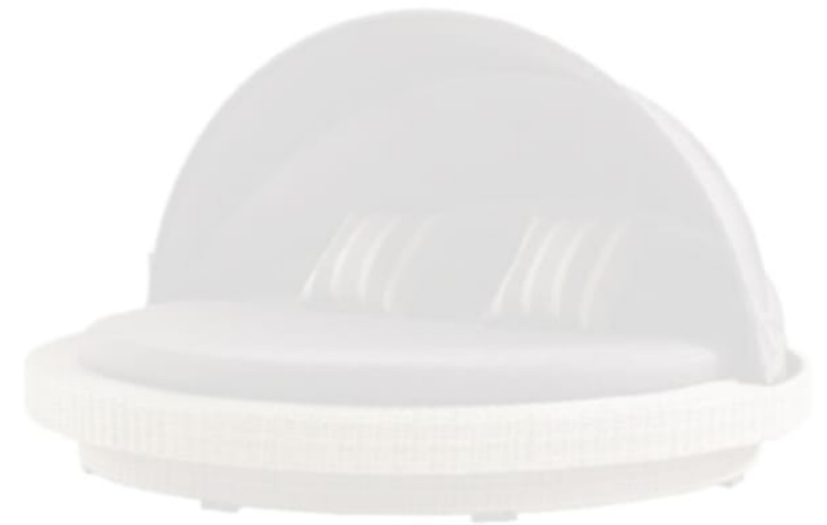
Bright daybed, Mudo Concept.