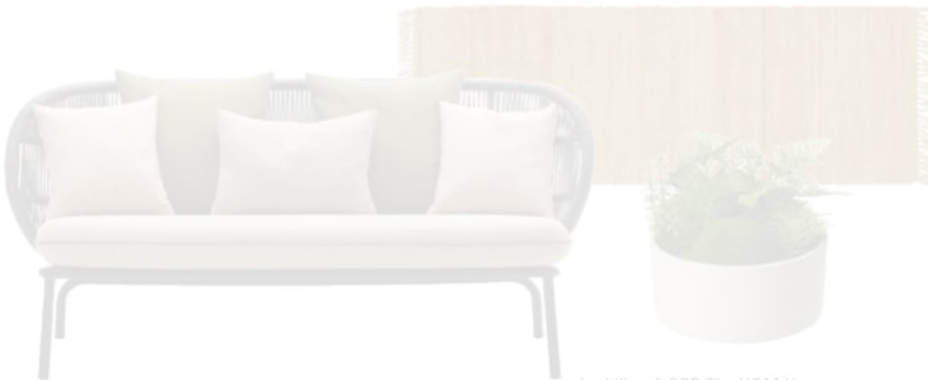
Kanepe, Cumba Selection.