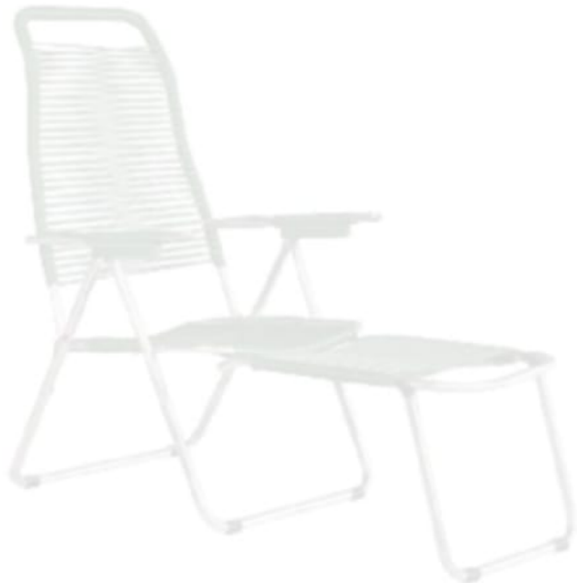
Fiam marka Spaghetti şezlong, Mozaik.