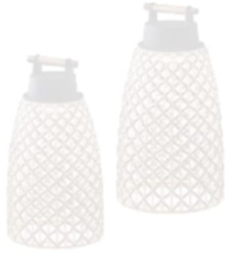
Bover marka açikhava aydınlatması: 685-745 Euro+KDV, Mozaik.