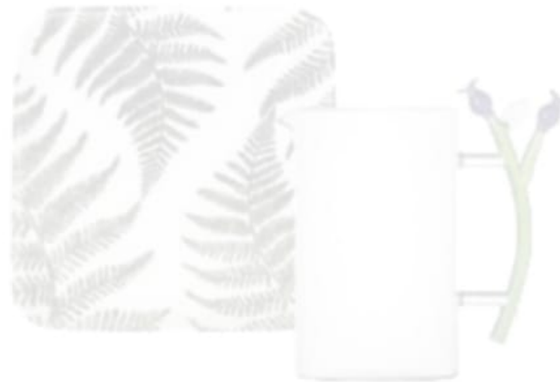
Süz tabak: 550 TL., Porland. Ichendorf marka sürahi: 2.445 TL., Sihar Mobilya.