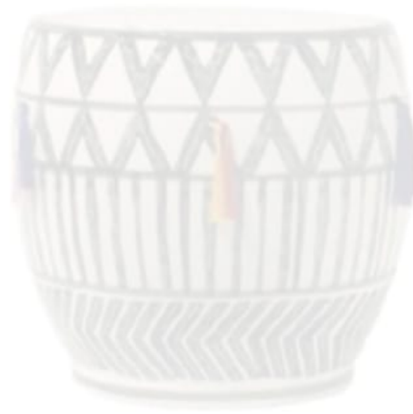
Tabure: 13.450 TL., Lasttouch.