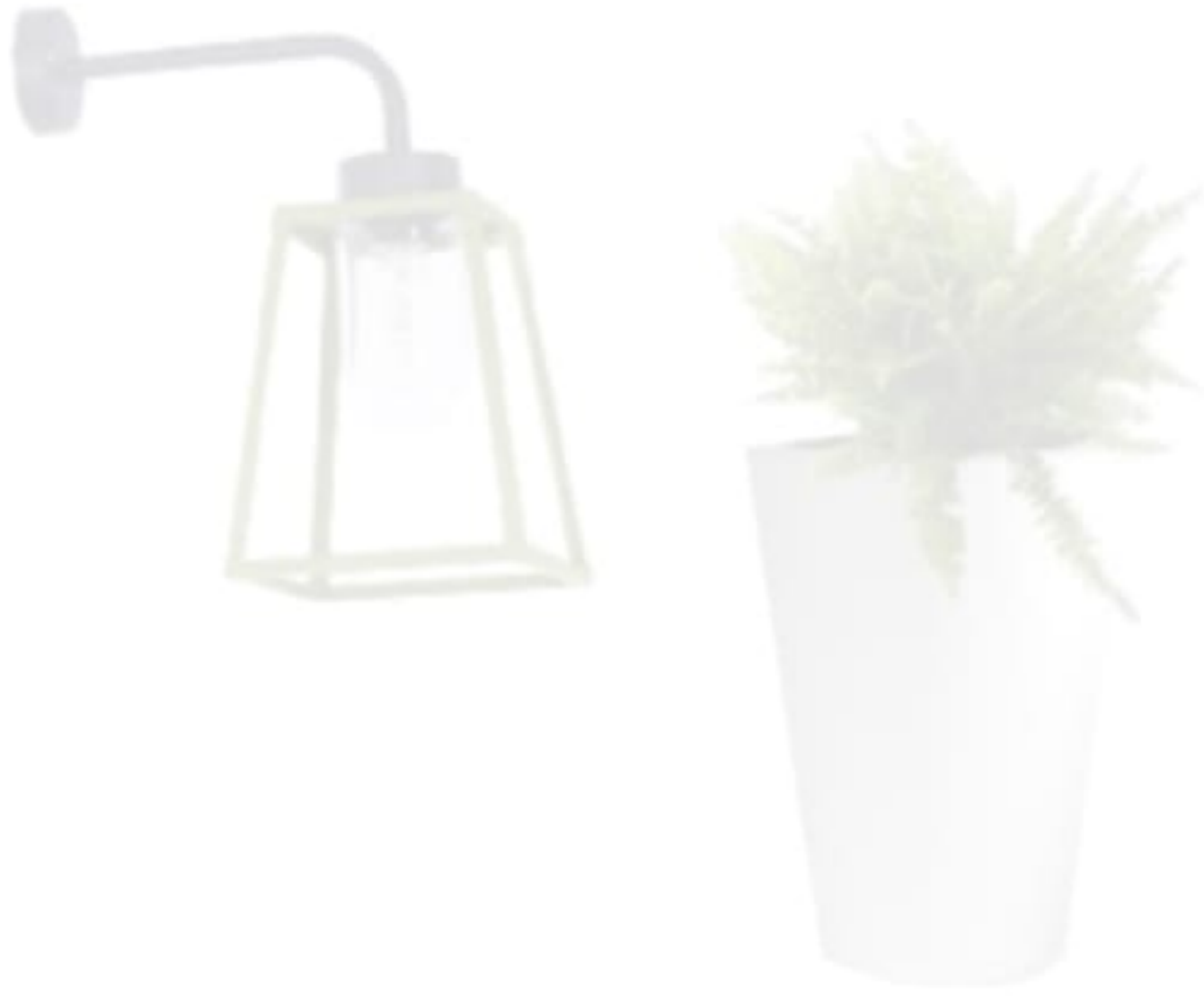
Roger Pradier marka aplik: 682 Euro, Tepta Aydınlatma. Teja aydınlatmalı saksı: 8.640 TL., Bakara Collection.