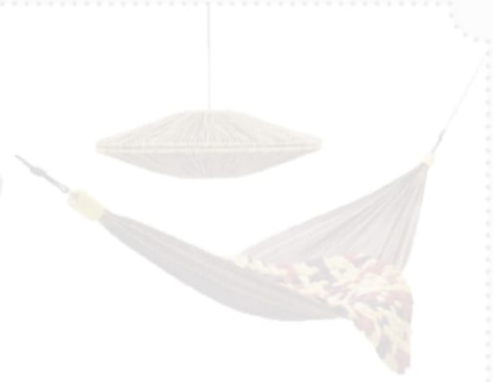
Sarkit aydınlatma, Cumba Selection. Paola Lenti marka Farniente marka, Mozaik.